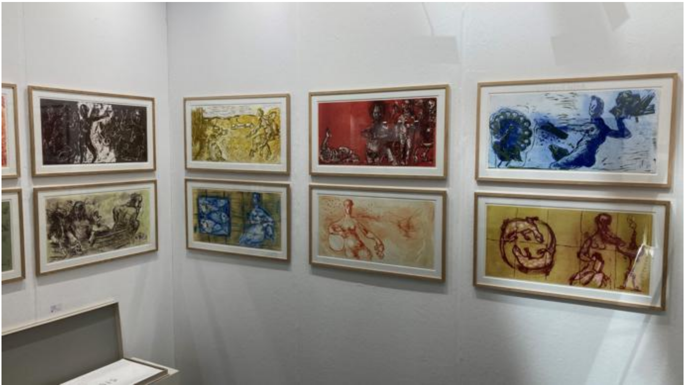
Genesis: Die Vorzeichnungen des Relief-Zyklus von Markus Lüpertz waren neben vielen anderen Arbeiten des Künstlers bei der „Art“ präsent.

Noch aus einem anderen Grund erweist sich Lüpertz als Magnet. Die von ihm geschaffene lebensgroße Massiv-Glasskulptur „David“ wartet mit Superlativen auf: Fast eine halbe Tonne bringt das Opus auf die Waage, ganze drei Monate benötigte es zum Abkühlen. Der Schöpfer hat den Preis festgelegt. 550.000 Euro soll die Skulptur kosten. „Wollen wir David mitnehmen?“ Den Scherz eines Mittsechzigers quittiert seine Begleiterin mit rollenden Augen.