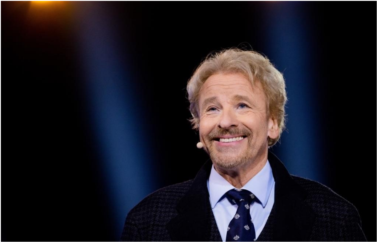
Wird für sein Lebenswerk ausgezeichnet: Der Entertainer Thomas Gottschalk erhält den MIE-Kunst Award.

15.09.2022 | Stand 15.09.2022, 10:07 Uhr